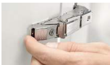
Montaggio e smontaggio facile grazie al meccanismo CLIP