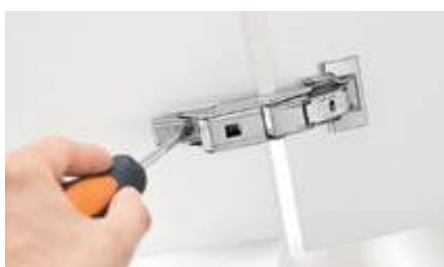
Consueta regolazione tridimensionale facile