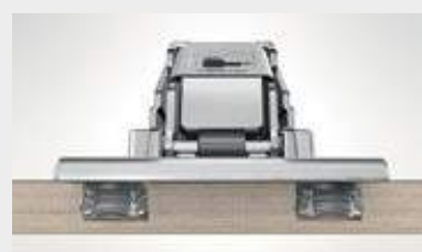
EXPANDO T, l'innovativo sistema di fissaggio