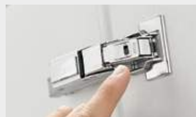
Selettore per la disattivazione di BLUMOTION