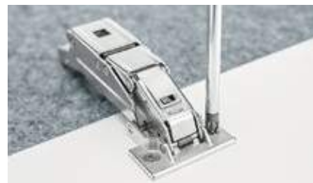
Stringere le viti, finito