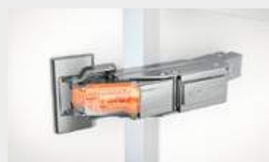
BLUMOTION integrato nel braccio