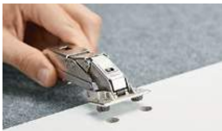
Inserire la bussola nei fori...