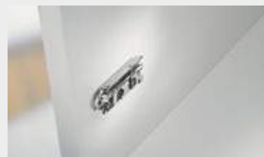
Fissaggio della piastrina di premontaggio in posizione standard